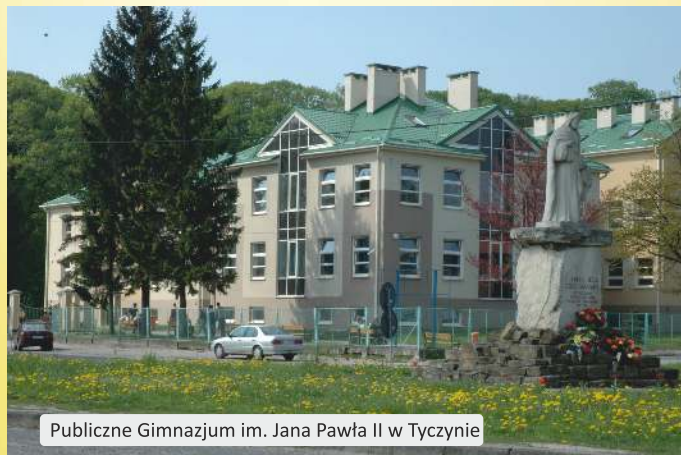
Publiczne Gimnazjum im. Jana Pawła II w Tyczynie

Najnowocześniejszym obiektem edukacyjnym WSLiZ-u jest Centrum Edukacji Międzynarodowej , oddane do użytku w 2011 r. Do dyspozycji studentów i naukowców jest kilkanaście specjalistycznych laboratoriów z nowoczesnym, zaawansowanym technologicznie sprzętem, również przystosowanym dla osób niedowidzących, z monitorami i drukarkami braila. Zastosowanie robota humanoidalnego, jaskini 3D i laboratorium symulującego giełdę, to rozwiązania innowacyjne na skalę europejską. W budynku dydaktycznym mieści się sala audytoryjna ze sprzętem do projekcji, sale wykładowe i ćwiczeniowe oraz biblioteka multimedialna.