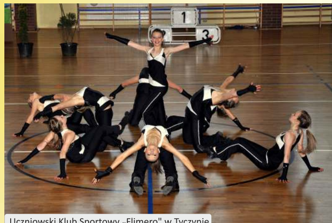
Uczniowski Klub Sportowy „Flimero” w Tyczynie

Oprócz swoich podstawowych zadań jakim są: wypożyczanie, gromadzenie i opracowywanie zbiorów bibliotecznych, prowadzi ona również działalność kulturalno-oświatową. Jest organizatorem spotkań z pisarzami i poetami, wystaw, lekcji bibliotecznych, połączonych z głośnym czytaniem bajek i baśni oraz lekcji muzealnych, z wykorzystaniem projekcji multimedialnych, warsztatów i konkursów plastycznych, wykładów z psychologii, literatury, etnografii, rajdów pieszych po najbliższej okolicy, wycieczek autokarowych.