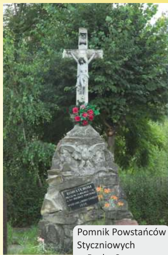
Pomnik Powstańców Styczniowych w Borku Starym

- Figura Serca Jezusowego (przy wjeździe do Tyczyna od strony północnej), upamiętniająca obchody 2000 lat chrześcijaństwa,