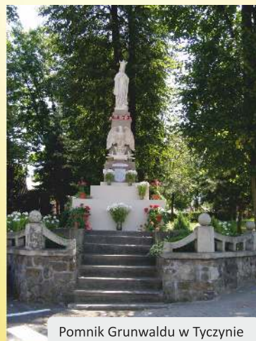
Pomnik Grunwaldu w Tyczynie

- Krzyż Wielkiego Jubileuszu przy skrzyżowaniu ulic Armii Krajowej i św. Krzyża, postawiony z okazji upamiętnienia Narodzin Jezusa Chrystusa. Takie same Krzyże wzniesiono w Hyżnem, Błazowej i Chmielniku.