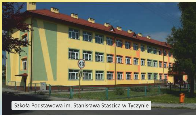
Szkoła Podstawowa im. Stanisława Staszica w Tyczynie