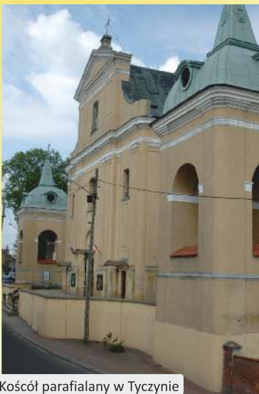
Kościół parafialny w Tyczynie

Kościół parafialny pw. św. Katarzyny Aleksandryjskiej- pochodzi z połowy XV w., z czasów, gdy właścicielem miasta był Jan Pilecki. Zniszczony przez pożar w 1627 r. został odbudowany (1631-38) przez Rafała Mikołaja Kostkę. Za czasów Jana Klemensa Branickiego kościół został gruntownie przebudowany w XVIII w. Dobudowano dwie wieże-dzwonnice, wykonano ogrodzenie i zakupiono nowe wyposażenie do świątyni. Do dziś kościół zachwyca bogactwami, barokowymi zdobieniami