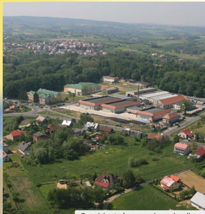
Tyczyńska strefa przemysłowo - handlowa

Bank Spółdzielczy w Tyczynie - proponuje szeroki wachlarz produktów finansowych dla osób fizycznych i prawnych.