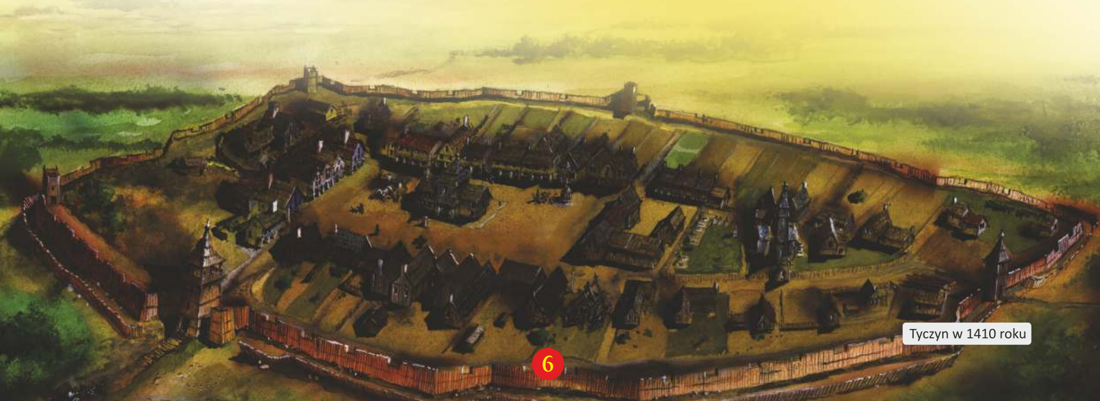
Tyczyn w 1410 roku

Również Branicy herbu Gryf, dalecy krewni Kostków (poprzez Wapowskich) mieli pretensje do tych dóbr. W 1670 r. Jan Klemens Branicki najechał zbrojnie Tyczyn, odbierając go Michałowi Działyńskiemu, co odbiło się głośnym echem na sejmie 1672 r. Kwestia tzw. sukcesji kostkowskiej ciągnęła się także po śmierci Branickiego w 1673 r. Ostatecznie w 1690 r. syn Jana Klemensa Branickiego, Stefan Mikołaj, zawarł ugodę ze Stanisławem Działyńskim (synem Michała), w wyniku której stał się prawnym posiadaczem Tyczyna z okolicznymi wsiami. Po jego śmierci w 1709 r. dobra odziedziczył syn - Jan Klemens Branicki - który zmarł bezpotomnie w 1771 r.