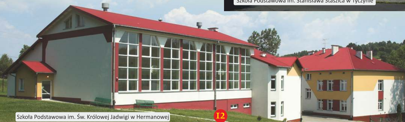
Szkoła Podstawowa im. Św. Królowej Jadwigi w Hermanowej