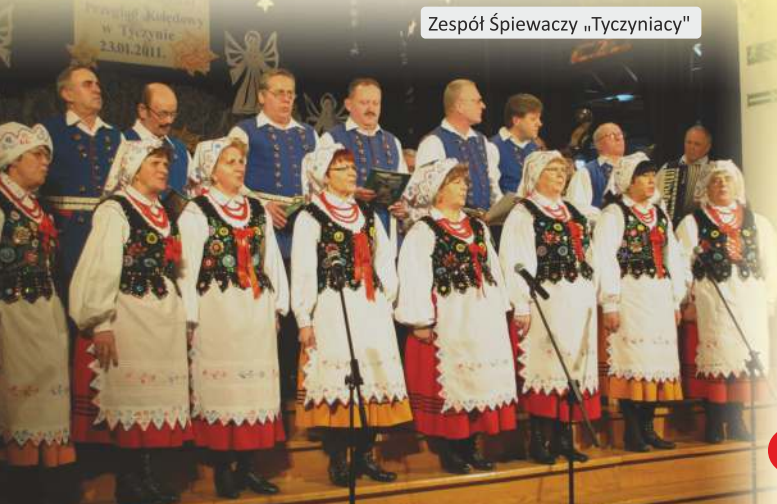
Zespół Śpiewaczy „Tyczyniacy”

Dodatkowo działalność kulturalną wspomaga Miejska i Gminna Biblioteka Publiczna w Tyczynie wraz z filiami w: Borku Starym, Hermanowej i Kielnarowej.