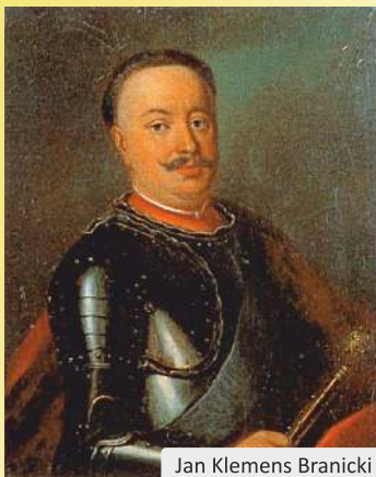
Jan Klemens Branicki