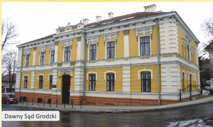
Dawny Sąd Grodzki

e) Sąd Grodzki , w Tyczynie, ul. Kościuszki 2,