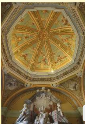
Kaplica św. Trójcy w kościele parafialnym w Tyczynie