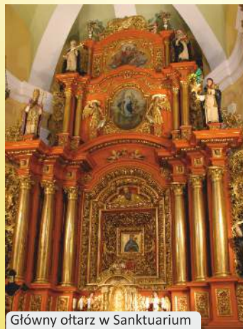
Główny ołtarz w Sanktuarium w Borku Starym