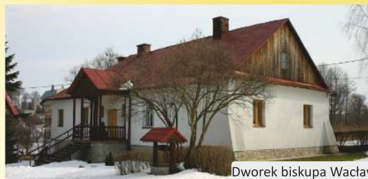
Dworek biskupa Wacława Betańskiego

d) dawny szpital dla ubogich w Tyczynie , ul. Kościuszki 3. Powstał pod koniec XV w. na terenie leżącym poza granicami miasta jako przytułek (szpital) dla ubogich. Obecnie mieści się tu Przedszkole Publiczne Sióstr Świętego Dominika.