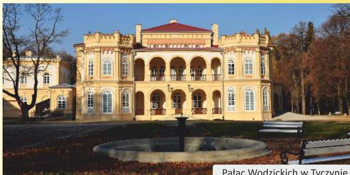
Pałac Wodzickich w Tyczynie