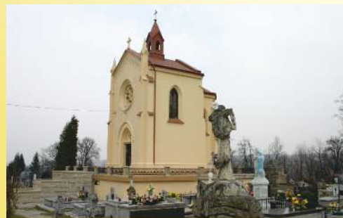
Kaplica grobowa rodziny Wodzickich