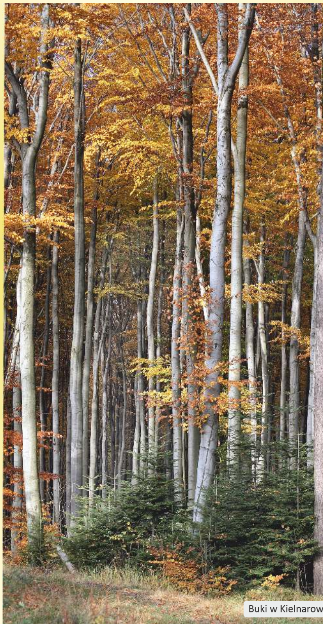
Buki w Kielnarowej