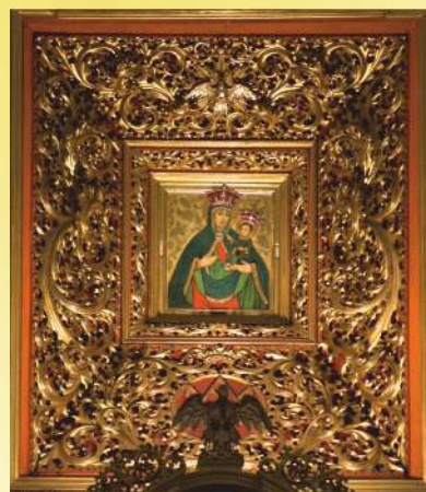
Cudowny obraz Matki Boskiej Borekiej

Do Sanktuarium należą jeszcze m.in. kaplice. Ponad klasztorem, na szczycie wzniesienia zwanego Jasną Górą (ok. 320 m n.p.m.) znajduje się kaplica Matki Bożej Bolesnej, zbudowana w 1896-97 r. Stąd roztacza się piękna panorama doliny Strugu i okolicznych wzniesień. Poniżej znajduje się zbudowana w 1779 r. kaplica św. Anny, z obrazem świętej namalowanym w XIX w.; za nią jest zakonny cmentarz.