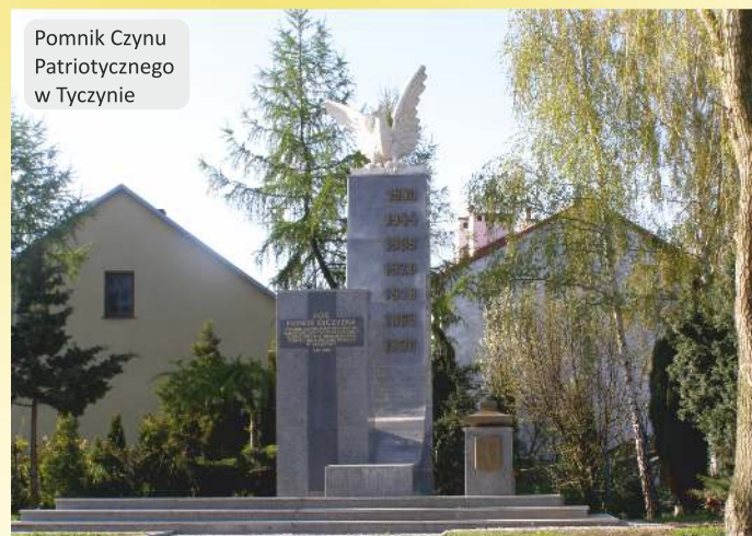
Pomnik Czynu Patriotycznego w Tyczynie