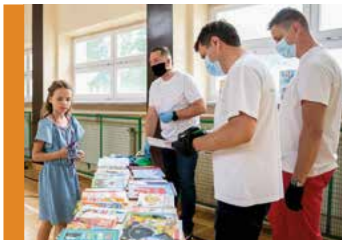
Po wakacjach planujemy zorganizować spotkania czytelnicze

Podczas tegorocznego zakończenia roku szkolnego uczniowie klasy drugiej otrzymali upominki oraz książki ufundowane przez Fundację Dobra Sieć . Wolontariusze HOPE wręczyli dzieciom zestawy higieniczne (żele antybakteryjne i maseczki) oraz na czas wakacji książki, które są ciekawą i zdrową alternatywą spędzania wolnego czasu. Finalnie ponad 50 pozycji książkowych ma trafić do klasowej biblioteki.