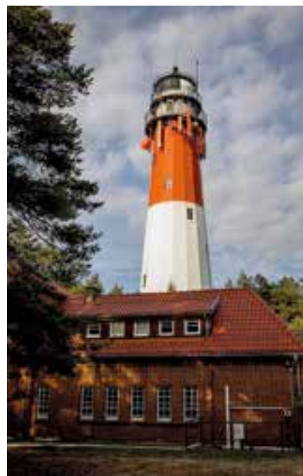
Przy dobrej pogodzie światło latarni Stilo widać z odległości ponad 40 kilometrów.

Przylądek Stilo – położony 10 kilometrów od Łeby – to wyjątkowe miejsce, do którego nie zaglądają tłumnie turyści, co nie oznacza, że jest nieatrakcyjne. Symbolem tego miejsca jest jedna z dwóch całkowicie metalowych latarni morskich w Polsce , która od stu lat wskazuje statkom właściwą drogę. Latarnia jest także świetnym punktem widokowym, z którego widać wydmy, lasy, jeziora Sarbsko i Łebsko oraz morze, a także popularnym miejscem... oświadczyć.