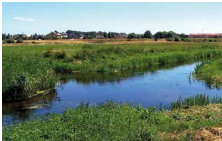
Skrzyżowanie rzek Wełna i Nielba między Poznaniem a Bydgoszczą.

Są tylko dwa miejsca na świecie, gdzie dwie rzeki krzyżują się ze sobą. Jedno z nich znajduje się w Wielkopolsce, w miejscowości Wągrowiec , gdzie pod kątem prostym krzyżują się rzeki: Wełna i Nielba . Ciekawostką jest to, że wody tych rzek mieszają się ze sobą w małym stopniu i nie ma wirów w miejscu skrzyżowania. Skrzyżowanie tych rzek nie jest zjawiskiem naturalnym. Powstało podczas prac melioracyjnych w latach 30. XIX wieku, których celem była ochrona Wągrowca przed zalewaniem wodami powodziowymi obu rzek oraz zapewnienie podczas suszy odpowiedniego spiętrzenia wód na Wełnie, by mógł działać na niej wodny młyn.