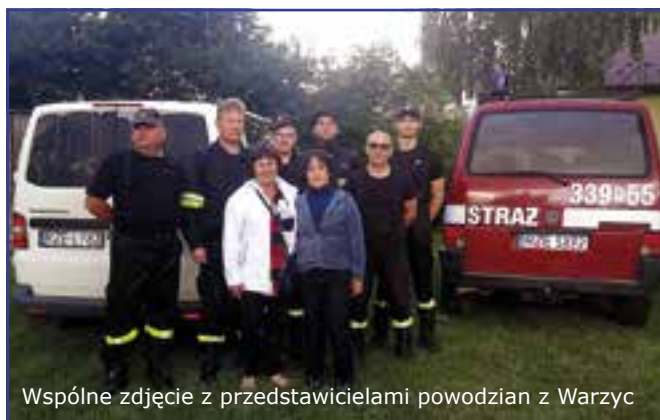
Wspólne zdjęcie z przedstawicielami powodzi z Warzyc

Część zebranych darów we wtorek 7.07 br. została zawieziona do Warzyc w powiecie jasielskim, gdzie mieszkańców również dotknęła klęska powodzi. W porozumieniu z miejscowym Caritasem pomoc została przekazana do najbardziej potrzebujących w tej miejscowości.