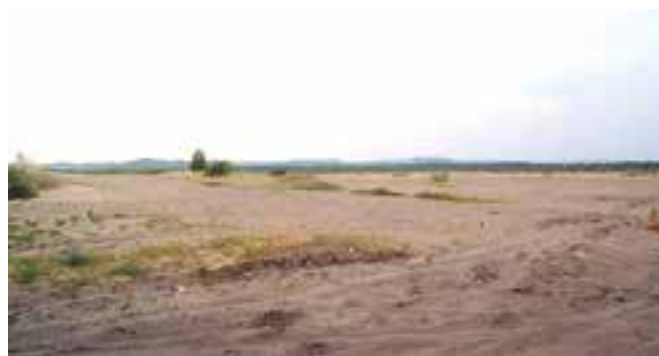
Po wojnie część Pustyni Błędowskiej użytkowano jako poligon wojskowy.

Żeby zobaczyć pustynię , nie trzeba jechać do Afryki. Wystarczy wybrać się w okolice Dąbrowy Górniczej, gdzie znajduje się największy w Europie obszar o charakterze pustynnym – Pustynia Błędowska . Obszar ten - o powierzchni ok. 33 km 2 - powstał w czasie epoki lodowcowej (piaski zostały naniesione przez topniejące wody lodowca). Do niedawna występowała tu burza piaskowa i zjawisko... fatamorgany. Trzeba się spieszyć, by zobaczyć tę pustynię, ponieważ już niedługo może zupełnie zarosnąć (sprzyja temu ekspansja roślinności). Cały obszar pustyni został objęty granicami obszaru Natura 2000. Występują tu rośliny m.in. o charakterze pustynnym i typowe dla wydym nadmorskich.