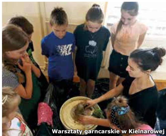
Warsztaty garncarskie w Kielnarowej

Program tegorocznych zajęć obejmował m.in. spotkania z paniami z Centrum Socjo-Pedagogicznego „Team”, które prowadziły zajęcia warsztatowe z profilaktyki uzależnień i socjoterapeutyczne. W ramach wakacyjnych spotkań odbyły się również warsztaty plastyczne, ceramiczne i pszczelarskie realizowane przez pracowników M-GOK. Opiekunowie grup organizowali również uczestnikom zajęć wycieczki piesze po najciekawszych miejscach w każdej miejscowości.