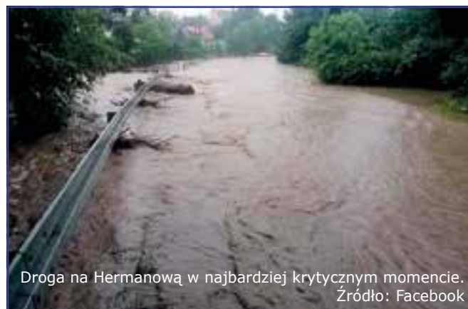
Droga na Hermanówkę w najbardziej krytycznym momencie. Źródło: Facebook

To nie rzeka, tylko ulica Grunwaldzka w Tyczynie w okolicach parku. Źródło: Facebook