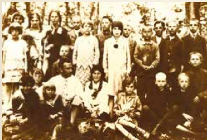
Fotografia wykonana w tym samym czasie i miejscu, niektóre osoby znamy z poprzedniej fotografii