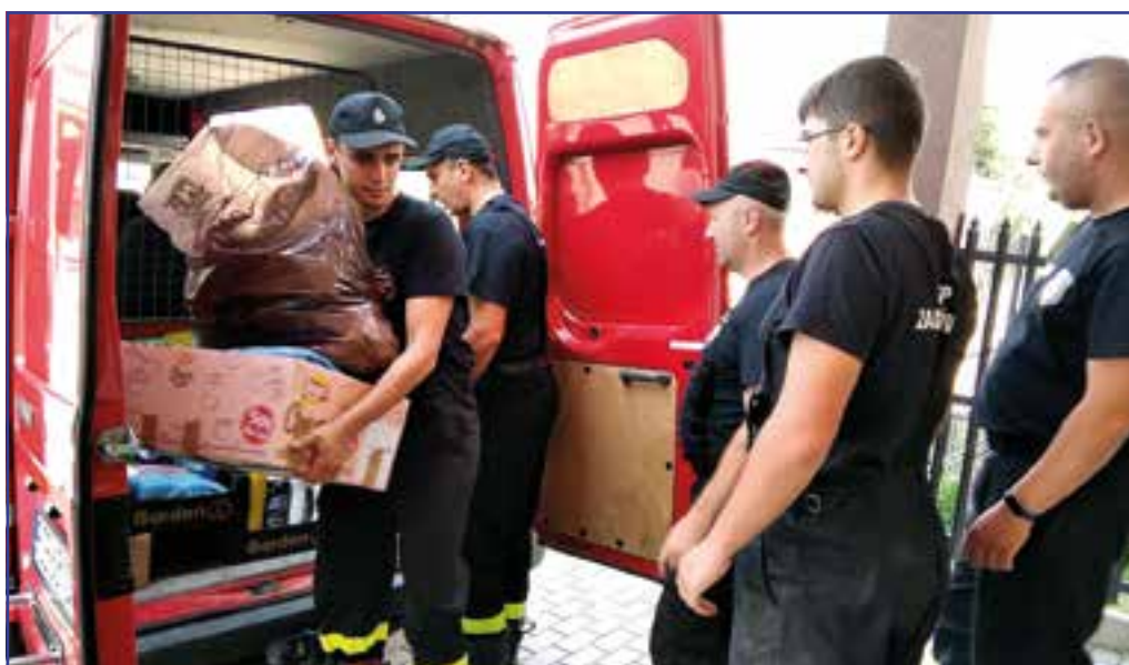
Strażacy z Zabratówki odbierają dary przywiezione przez druhow z Kielnarowej

Udało się zebrać sporą ilość nieużywanych koców, pościeli i ręczników, a także środków czystości oraz żywność. Wśród darczyńców znalazła się także osoba, która przekazała rower. Byli też tacy, którzy wsparli zbiórkę pieniężnie. Dzięki zebranych funduszom zakupiono nową pralkę. Wszystkie rzeczy przewożone i przekazane zostały w sobotę 11.07 br. druhom z Ochotniczej Straży Pożarnej w Zabratówce, którzy rozdysponowali je wśród poszkodowanych mieszkańców. Pralka została bezpośrednio przekazana osobie potrzebującej, co wywołało sporo uśmiechu, ale i łez wzruszenia.