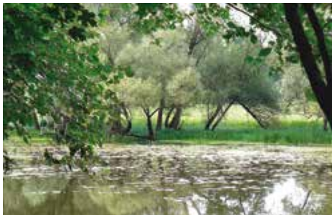
Wilgotny las łęgowy w Żerkowsko-Czeszowskim Parku Krajobrazowym

Nie trzeba wybierać się do Szwajcarii, by poczuć klimat tego kraju. W południowej części Wielkopolski , wśród rozlewisk rzeki Warty, znajdują się bardzo malownicze tereny niewysokich wzgórz, które nazwano Szwajcarią Żerkowską (od nazwy pobliskiego miasta Żerków). Jest to obszar na tyle interesujący przyrodniczo, że został objęty ochroną w ramach Żerkowsko-Czeszowskiego Parku Krajobrazowego. W centrum tego obszaru znajduje się m.in. pałac w Śmiełowie, w którym mieści się Muzeum Adama Mickiewicza. Na terenie parku znajdują się także lasy łęgowe , które stanowią największy i najlepiej zachowany tego typu obszar w Europie.