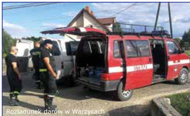
Rozładunek darów w Warzycach