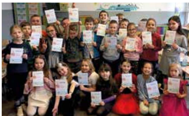
Uczniowie klasy II z pamiątkowymi dyplomami podsumowującymi projekt „Czytam z klasą”

Projekt czytelniczy realizowany był od 1.10 do 30.05 i składał się z trzech modułów. W każdym z nich wybrana była jedna lektura, do której wykonano co najmniej cztery zadania. Lektury były czytane przez nauczyciela lub samodzielnie przez uczniów, a także przez rodziców i panią bibliotekarkę. Po zrealizowaniu każdego modułu nauczyciel umieszczał na stronie projektu sprawozdanie w formie opisu i kilku zdjęć oraz otrzymywał od autora projektu potwierdzenie realizacji tego modułu. Drugoklasiści przeczytali i omówili: Niesamowite przygody 10 skarpetek - czterech prawych i 4 lewych Justyny Bednarek, Cukierku, ty łobuzie Waldemara Cichonia, Detektywa Pozytywkę Grzegorza Kasdepke oraz lekturę O psie, który jeździł koleją Romana Pisarskiego.