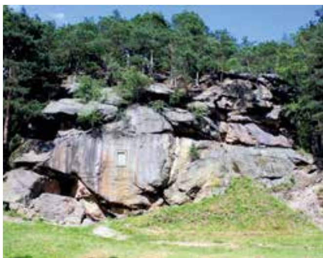
Tak wygląda skała „Grunwald” w rezerwacie przyrody Skamieniałe Miasto w Ciężkowicach.

Grunwald to nie tylko miejscowość znana ze średniowiecznej bitwy z Krzyżakami. To także nazwa jednej ze skał, jakie tworzą Skamieniałe Miasto w małopolskich Ciężkowicach. Ten rezerwat przyrody nieożywionej to skupisko fantazyjnie ukształtowanych form skalnych, które przypominają swoim wyglądem „miasto zamienione w kamień”. Każda skała ma swoją nazwę i historię, którą warto poznać podczas zwiedzania. Skamieniałe Miasto to jedna z największych atrakcji przyrodniczych Małopolski i jednocześnie świetne miejsce na wycieczki z mniejszymi pociechami, dlatego warto wybrać się tu na rodzinną wakacyjną wyprawę.