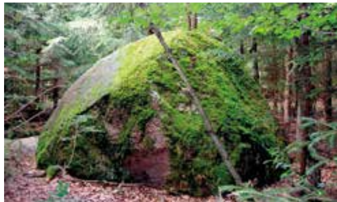
W Puszczy Boreckiej można spotkać liczne głazy narzutowe.

A teraz wybierzmy się do Puszczy Boreckiej . Ten kompleks leśny - o bliskiej nam nazwie - położony jest na Pojezierzu Ełckim, w gminie Kruklanki (na wschód od jeziora Mamry). Puszcza zajmuje obszar ponad 200 km 2 , na którym występują lasy liściaste i iglaste oraz liczne torfowiska, źródłiska i polodowcowe jeziora, a także będące pomnikami przyrody głazy narzutowe (np. Diabelski Kamień). Atrakcją regionu są żyjące tu na wolności żubry (które można obserwować z platformy widokowej w Wolisku), ponadto puszcze zamieszkują inne ciekawe zwierzęta: jenot, tchórz czy piżmak, a z ptaków: orzeł bielik czy bocian czarny. Do puszczy wiodą liczne szlaki rowerowe. Można również skorzystać ze spływów kajakowych.