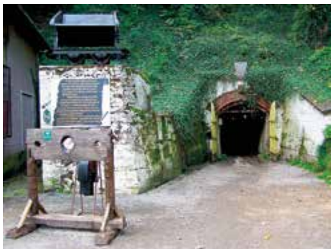
Wejście do Muzeum Górnictwa i Hutnictwa Złota.

Kolejne miejsce warte zobaczenia w Polsce to je-dyny w Europie podziemny wodospad w Złotym Stoku – miście leżącym na Dolnym Śląsku, bezpośrednio przy granicy z Czechami. Miasto to jest najstarszym ośrodkiem górniczo-hutniczym w Polsce (działającym nieprzerwanie przez... 700 lat!). Znajduje się tu Muzeum Górnictwa i Hutnictwa Złota , które oferuje wyprawę do sztolni „Czarnej” – to tu można zobaczyć 10-metrowy podziemny wodospad. Na uwagę turysty zasługuje także Średniowieczny Park Techniki – jedyny taki w Europie – będący repliką średniowiecznej osady górniczej, w której można zobaczyć dawne maszyny górnicze.