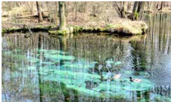
Rezerwat Niebieskie Źródła opisywali podróżnicy i przyrodnicy już w połowie XVIII w.

Udajemy się teraz do Tomaszowa Mazowieckiego , gdzie w granicach miasta znajduje się rezerwat przyrody nieożywionej - krasowe Niebieskie Źródła , które nigdy nie zamarzają (ich stała temperatura to około 9 st. C). Wywierzyska te stanowią jedno z najciekawszych zjawisk krasowych w Europie . Z popękanych skał wapiennych wytryskuje woda, która przybiera kolor niebieskozielony (jest to efekt działania rozproszonego światła słonecznego). Woda w tych źródłach zmienia odcień barwy w zależności od stanu pogody, stopnia nasłonecznienia czy zachmurzenia. Ciekawostką są pulsujące gejzery z piasku, który jest podrzucany przez źródlaną wodę.