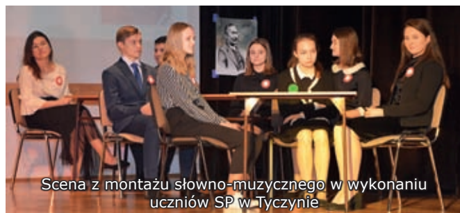
Scena z montażu słowno-muzycznego w wykonaniu uczniów SP w Tyczynie