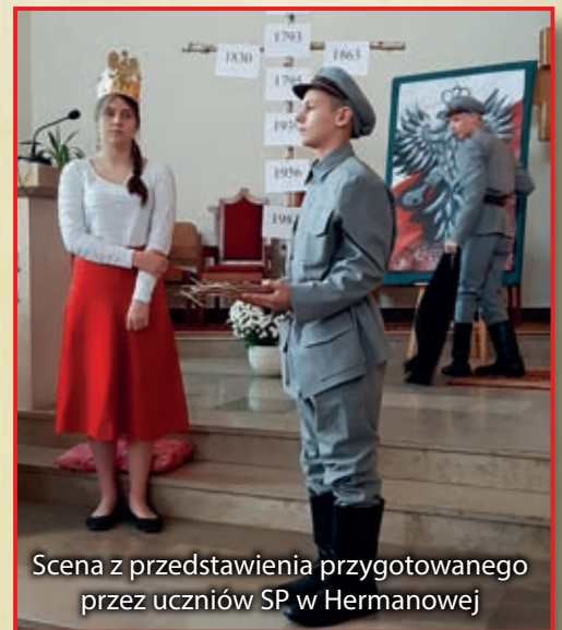
Scena z przedstawienia przygotowanego przez uczniów SP w Hermanowej