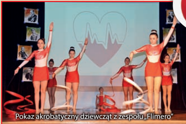
Pokaz akrobatyczny dziewcząt z zespołu „Flimero”