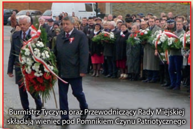
Burmistrz Tyczyna oraz Przewodniczący Rady Miejskiej składają wieniec pod Pomnikiem Czynu Patriotycznego