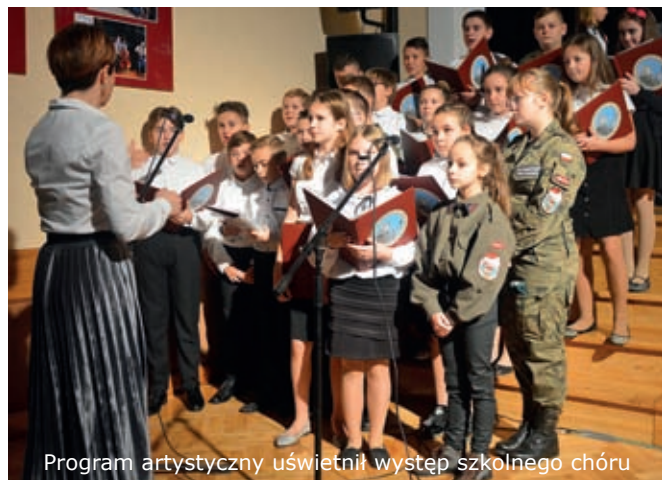
Program artystyczny uświetnił występ szkolnego chóru