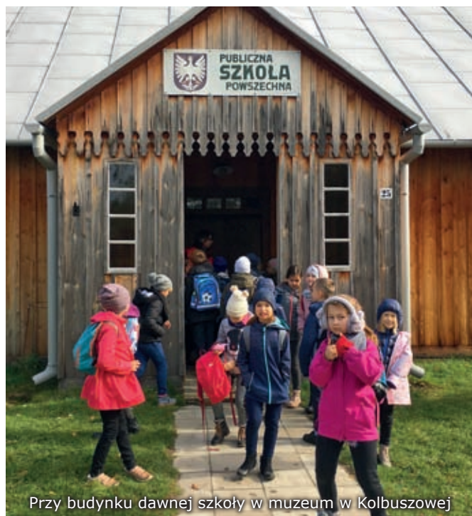
Przy budynku dawnej szkoły w muzeum w Kolbuszowej

9.10 br. uczniowie kl. II udali się na wycieczkę do Muzeum Kultury Ludowej oraz Parku Etnograficznego w Kolbuszowej. Celem wycieczki, oprócz dobrej zabawy, było pokazanie dzieciom warunków życia na wsi w dawnych czasach. Uczniowie z zainteresowaniem oglądali wnętrza chat i budynki gospodarcze, spichlerz, kościół oraz szkołę, mogły także obserwować zwierzęta hodowlane. Drugoklasiści wzięli również udział w lekcji kaligrafii w szkole sprzed 100 lat. We wnętrzu przedwojennej sali lekcyjnej, wypełnionej kałamarzami, piórami, rysikami i tabliczkami łupkowymi, dzieci uczyły się pisać nietypowymi przyborami. Dowiedziały się także, jakie stosowano kary w dawnej szkole. Pełni wrażeń i z zadowolonymi minami wróciliśmy do naszej szkoły.