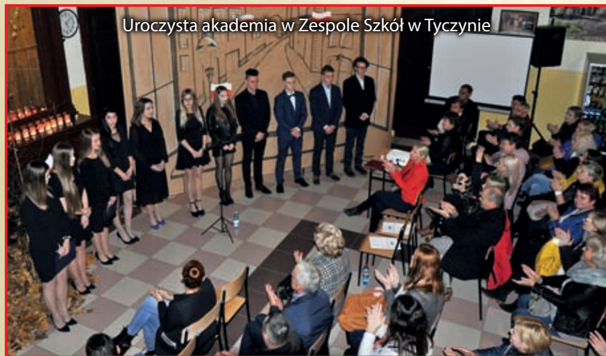
Uroczysta akademii w Zespole Szkół w Tyczynie