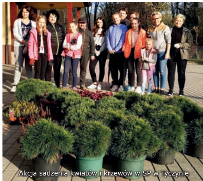
Akcja sadzenia kwiatów i krzewów w SP w Tyczynie

Kształtowanie postaw wolontariackich, integracja wielopokoleniowa, rozbudzanie świadomości obywatelskiej oraz wychowanie do wartości zawsze zajmowało szczególną rolę w edukacji uczniów naszej szkoły. Miarą patriotyzmu jest także poszanowanie środowiska przyrodniczego i jego ochrona. Nasza szkoła znalazła się w gronie nielicznych ośrodków z województwa podkarpackiego, które zdobyły dofinansowanie działań ekologicznych w ramach grantu konkursowego pt. „Ekologia integralna encykliki Laudato si’ w działaniu Wspólnot Caritas i społeczności lokalnych” .