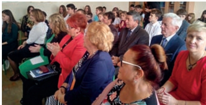
Zgromadzona publiczność podczas spotkania poświęconego pamięci A.M. Nowak