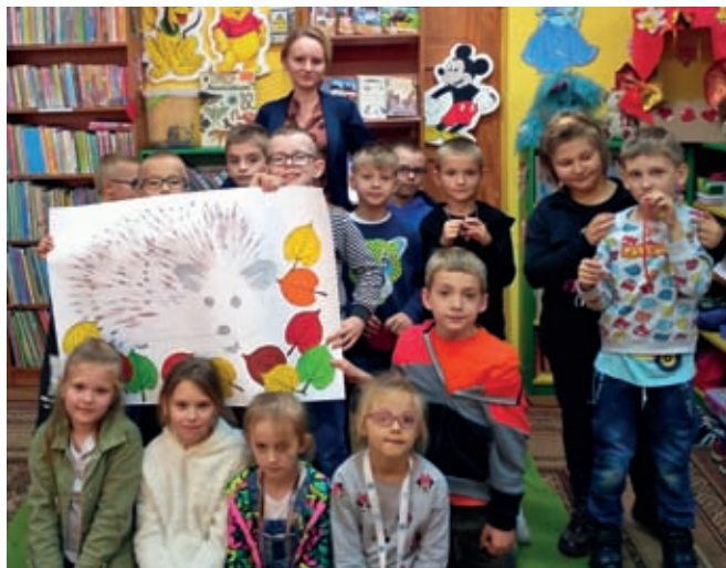
Pierwszaki z jesiennym jeżem

6 listopada br. na zajęciach edukacyjnych gościliśmy uczniów z kl. I, z którymi rozmawialiśmy o zwierzętach zapadających w sen zimowy. Podczas spotkania dzieci m.in. słuchały opowieści o zwyczajach zwierząt z książki Adama Wajraka pt. „Zwierzaki Wajraka” , a za poprawnie odpowiedzi na pytania i zagadki mogły wylosować nagrodę. Niespodzianką dla uczestników był mały jeżyk ukryty w koszu ze skarbami jesieni oraz kolorowe listki za dobre zachowanie.