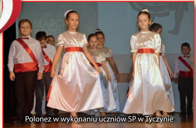
Polonez w wykonaniu uczniów SP w Tyczynie