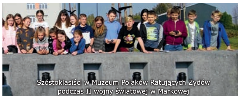
Szóstoklasiści w Muzeum Polaków Ratujących Żydów podczas II wojny światowej w Markowej

23 października br. szóstoklasiści odwiedzili Muzeum Polaków Ratujących Żydów podczas II wojny światowej w Markowej . Tam uczestniczyli w warsztatach, których tematem był Holocaust oraz prezentacja postaw Polaków wobec społeczności żydowskiej w czasie okupacji niemieckiej. Uczniowie mieli szansę dowiedzieć się o tym, jak tragiczne było położenie Żydów w Polsce okupowanej przez nazistowskie Niemcy. Zostały omówione represje wobec społeczności żydowskiej na podstawie przykładów, które uchwycone także zostały na stałej ekspozycji muzeum. Warsztaty uświadomiły dzieciom dramat Holocaustu – zarówno zbiorowy, jak i indywidualny, dotyczący całe społeczeństwo okupowanego kraju.