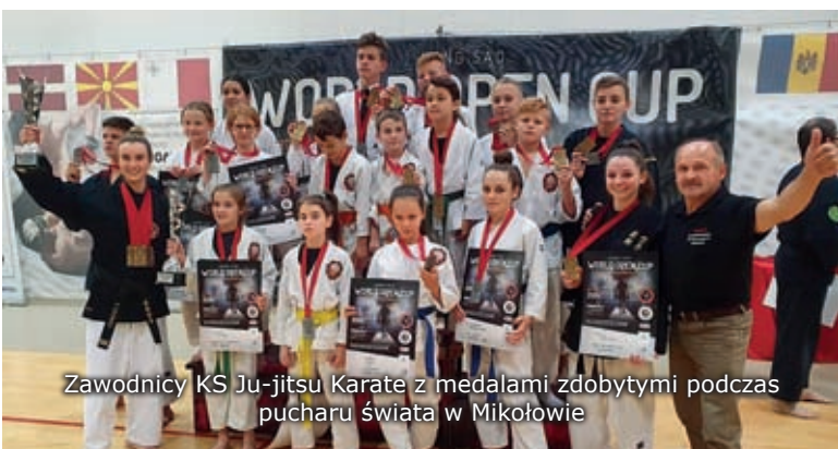
Zawodnicy KS Ju-jitsu Karate z medalami zdobyłymi podczas pucharu świata w Mikołowie