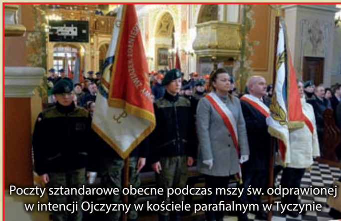
Początki sztandarowe obecne podczas mszy św. odprowadzonej w intencji Ojczyzny w kościele parafialnym w Tyczynie