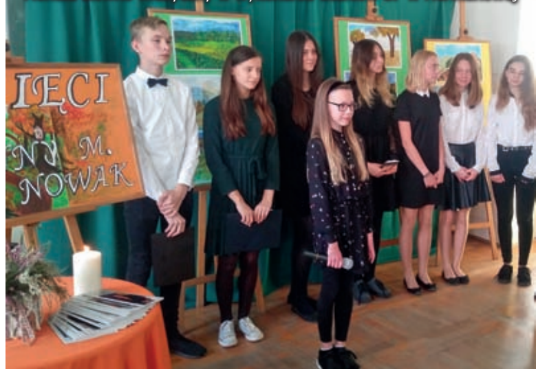
Montaż słowno-muzyczny w wykonaniu uczniów SP w Hermanowej