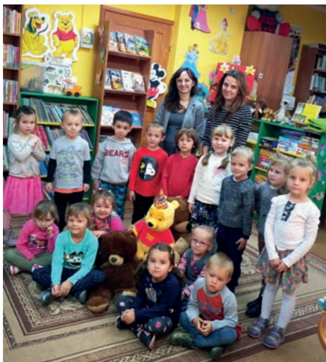
Urodzinowe spotkanie z Kubusiem Puchatkiem w bibliotece

Początkiem listopada w bibliotece w Kielnarowej obchodziliśmy z grupą przedszkolaków urodziny Kubusia Puchatka . Jak to na urodzinach bywa, nie zabrakło tortu, balonów oraz poczęstunku i grupy małych przyjaciół jubilata. Dzieci chętnie słuchały piosenek i opowieści o Kubusiu. Zaskoczeniem dla przedszkolaków była duża ilość książeczek zgromadzonych w bibliotece, których głównym bohaterem jest Kubuś Puchatek. Na spotkaniu był obecny również Miś Misiulek, którego dzieci znały z opowiadania z naszych poprzednich zajęć. Bardzo miłe było to nasze „misiowe świętowanie”. Przedszkolaczkom i wychowawczyni bardzo dziękujemy za udział w zajęciach.