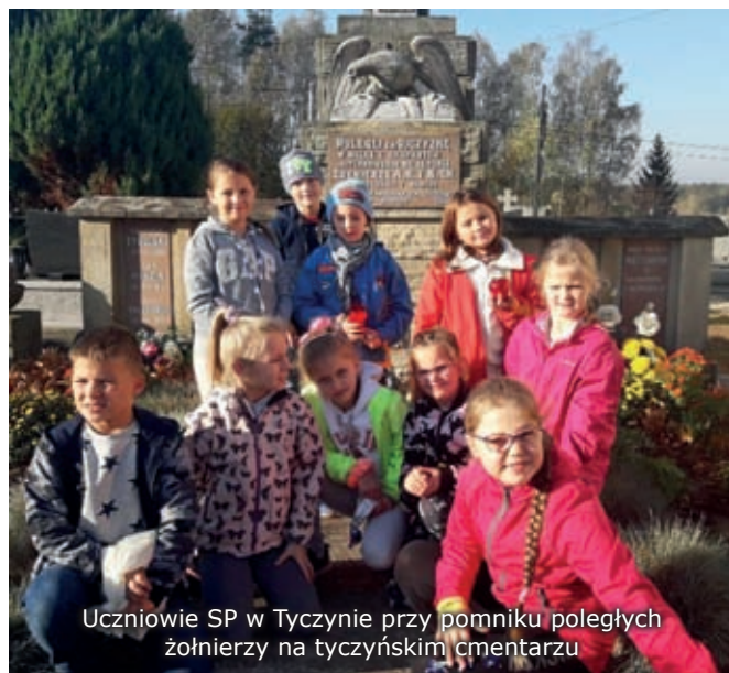
Uczniowie SP w Tyczynie przy pomniku poległych żołnierzy na tyczyńskim cmentarzu