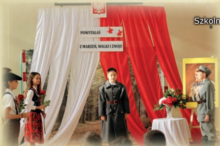
Szkolne uroczystości w Borku Starym