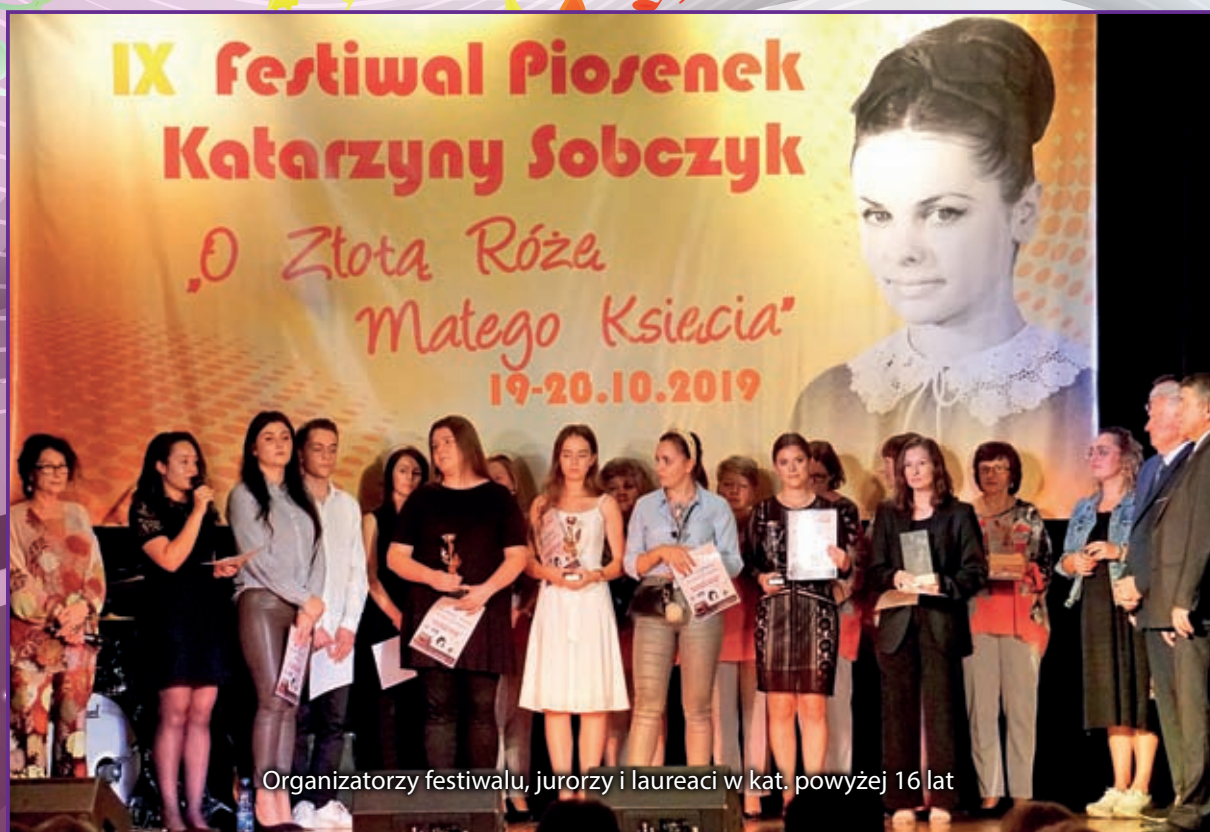
Organizatorzy festiwalu, jurorzy i laureaci w kat. powyżej 16 lat